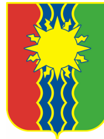
Администрация Города Братска

Глубокоуважаемые коллеги! в октябре 2024 г. в г. Братске Иркутская область, Сибирь, Россия состоится