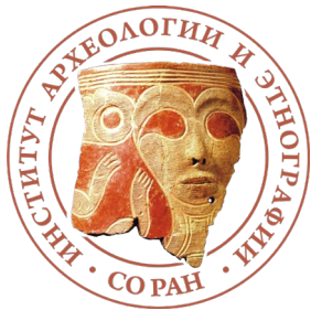
Институт археологии и этнографии Сибирского Отделения РАН